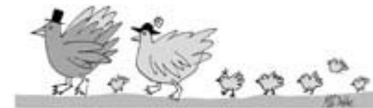
15. Mai: Tag der Familie