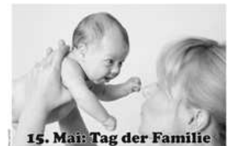
15. Mai: Tag der Familie