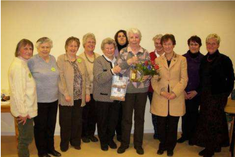
Bild 5. v.r.) an diese Zeit im Ehrenamt zurückdenkt, kommt auch ein bisschen Wehmut auf. Es hat ihr viel Freude gemacht, mit den Damen durch Besuche zum Geburtstag, Nachmittage in den Seniorenheimen, den Geburtstagskaffee und vieles mehr, den Kontakt