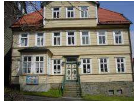
Braucht eine Investition in die Zukunft: Das künftige „Pfarrgemeindehaus“